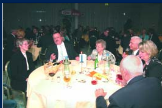
Bilder eines gelungenen Abends