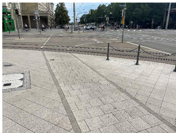
Breiter Weg ggü. Allee-Center